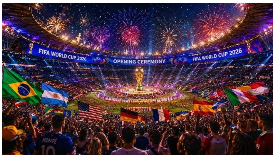
Cảnh tượng bùng nổ của ngày khai mạc Thế Vận Hội 2026 tại Mỹ Tây Cơ

Jules Rimet Người đàn ông Pháp đứng sau Thế Vận Hội Bóng Đá Thế Giới đã lấy cảm hứng từ Đức Giáo hoàng Lêô XIII và giáo lý xã hội Công giáo của Ngài.