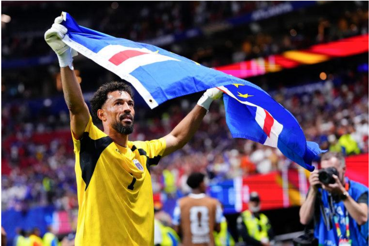
Cảnh đội Úc ăn mừng khi đội Soccoroo của Úc thắng đội Thổ Nhĩ Kỳ...